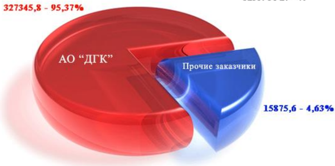
СТРУКТУРА ВЫРУЧКИ ЗА 2018 ГОД С РАЗБИВКОЙ ПО ЗАКАЗЧИКАМ ТЫС. РУБ. - %

Структура выручки АО «Нерюнгриэнергоремонт» за 2018 год с разбивкой по Заказчикам выглядит следующим образом: