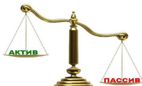
Таблица № 15

Капитал Общества по итогам 2018 г. составил -25 455 тыс. руб., что на 535 тыс. руб. (2,1%) больше предыдущего года. Нераспределенный убыток прошлых лет снизился на 16 430 тыс. руб. (31%), нераспределенная прибыль отчетного года ниже показателя предыдущего года 15 895 тыс. руб. (96,7%). Совокупные обязательства Общества за 2018 год снизились на 6 616 тыс. руб. (7%) и составили 88 511 тыс. руб., что, в основном, вызвано снижением кредиторской задолженности по полученным займам.